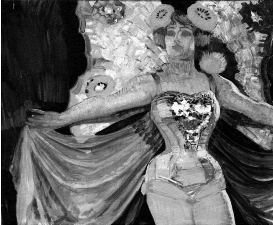
František Kupka, Kabarétáncos , 1900 körül, olaj, vászon, 46x55 cm

Prágában a város, az idő, a fiatal művészek egyszerűen rémületbe ejtettek. Azzal az eltökélt szándékkal repültem vissza Amerikába, hogy teszek valamit értük. Sikerült megnyernem a Ford Alapítványt, hogy még a bölcsészhallgatókat is támogassák. Többé-kevésbé szabad kezet kaptam egy cseh diákoknak szóló, meglehetősen nagylelkű, hathónapos ösztöndíj megszervezésében. Az ösztöndíjasok kiutazhattak, és bármilyen könyvet, amit csak kértek, megkaptak. Csodálatos lehetőség volt. Az első meghívott Václav Havel volt, aztán Chaloupecký, Slavík... Az első tíz ember meg is érkezett Amerikába, de Václav Havel nélkül, aki Prágában dolgozott valamin, és ezért elhalasztotta az indulását. Ám amikor útnak indulhatott volna Amerikába, az orosz tankok már bevonultak Prágába... Később a férjemmel pénzt küldtünk az emigránsok számára Bécsbe és más európai országokba. Kértük az Amerikában élő cseh ösztöndíjasokat, hogy segítsenek, de néha szembe találtuk magunkat a legrosszabb cseh fajtával, amelyik inkább egy kocsit vásárolt magának, mintsem másokon segített volna.