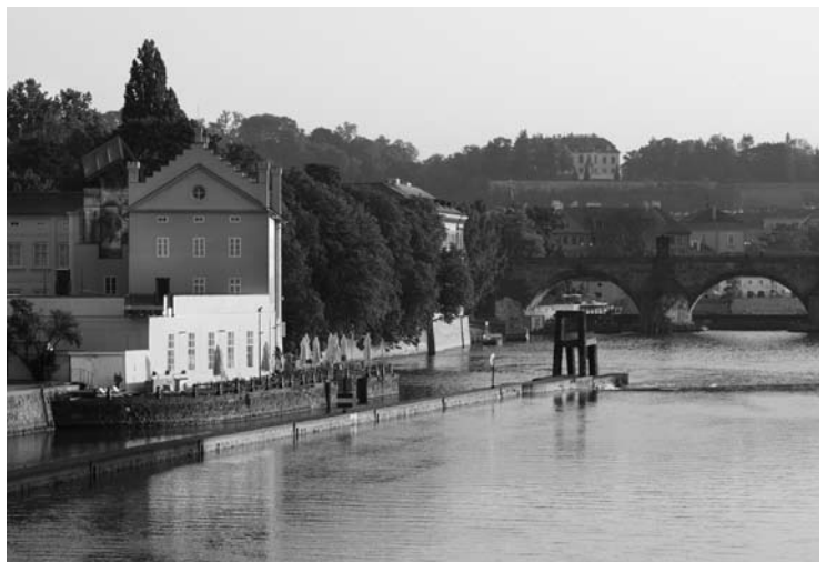
A múzeum épülete a Károly híd tövében

– A férjem nagyon jó gazdasági szakember volt, tudta, hogy a minőségi művészetbe fektetett pénz értékálló befektetés. Kezdetben a férjem pénzéből, majd ingatlaneladásból vásároltunk műtárgyakat. Ám mindez egyetlen képpel kezdődött még Párizsban, amelyet néhány dollárért vettünk meg. Művészeti tanulmányaim során