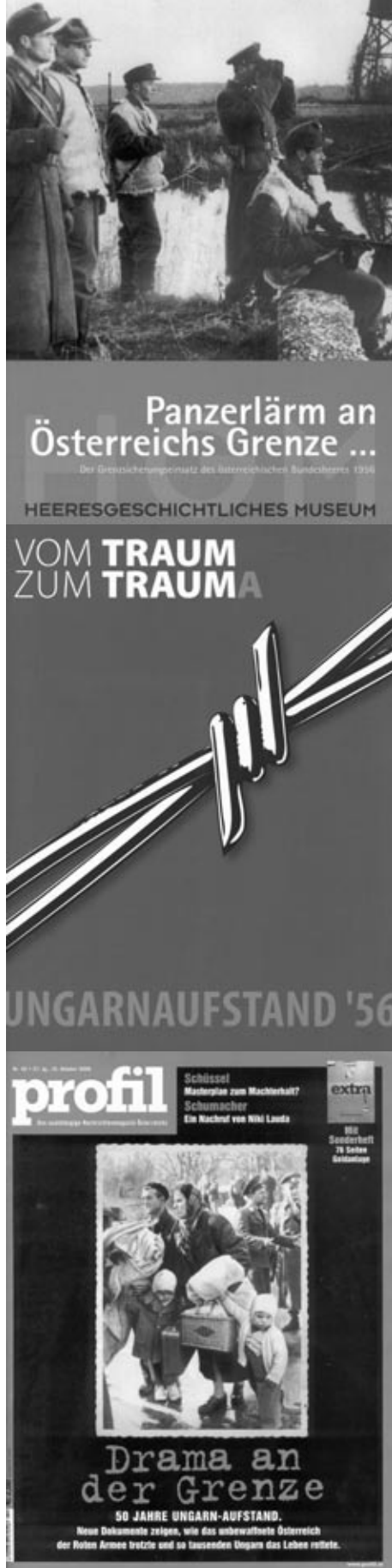
A Hadtörténeti Múzeum kiállítását kísérő kötet, a Burgenlandi Tartományi Múzeum kiállítás-katalógusa és a Profil c. hetilap címlapja

Az írott sajtó is nagy terjedelmet szentelt a magyar forradalom évfordulójának. Minden színvonalasabb napi- és hetilapban ( Der Standard , Die Presse , Profil ) megjelent legalább egy melléklet a temáról. Több cikk firtatta, mi lett a magyar menekültekből? A számos magyar sikertörténet tanúsága szerint integrációjuk szinte zökkenőmentesen zajlott, amiben persze a személyes kvalitások mellett fontos szerepe volt az éppencsak elkezdődött gazdasági fellendülésnek is.