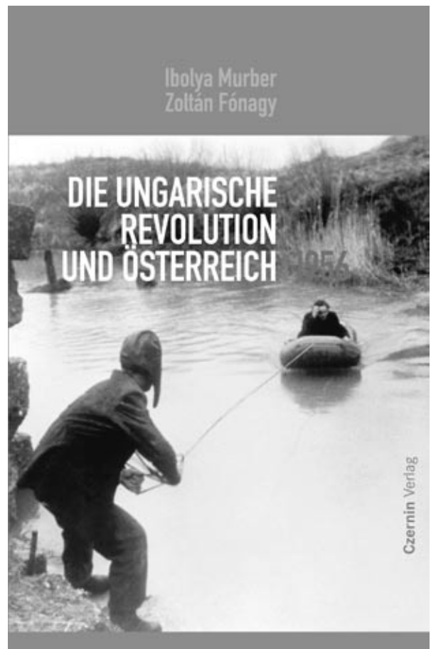
A magyar forradalom és Ausztria 1956

szággyűlési bizottsági elnök, több EU-parlamenti képviselő, osztrák és magyar polgármesterek, valamint a diplomáciai testület tagjai. Magas szinten képviseltették magukat a két ország egyházai, megjelentek a gaz-