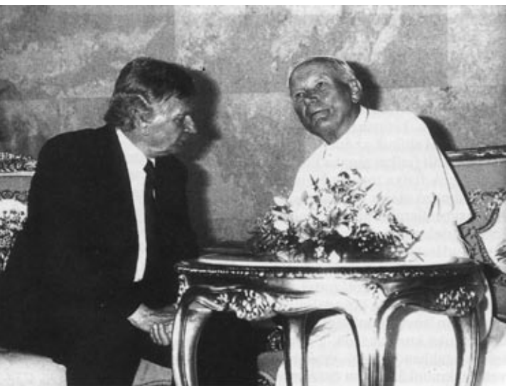
Antall József és II. János Pál pápa

A szellemi, irodalmi életünknek ez a polarizáltsága, mely végigvonul az elmúlt évtizedek irodalmi, szellemi életén, rávetődik a gyakorlati politikára. A gyakorlati politikának egyáltalán nem használ, hogy ilyen mértékű szellemi-ideológiai nyomás alatt van, és a szellemi, irodalmi életnek sem használ, hiszen ez visszahat.