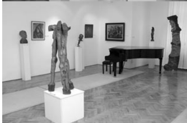
A múzeum állandó tárlata

De tartottunk már képzőművészeti és irodalmi beszélgetéseket, kamarakoncerteket, könyvbemutatókat is. Például itt volt Dušan Šimko kassai származású, Svájcban élő író Esterházy lakája című könyvének a bemutatója, mely tavaly jelent meg magyarul a Kalligram Kiadó gondozásában.