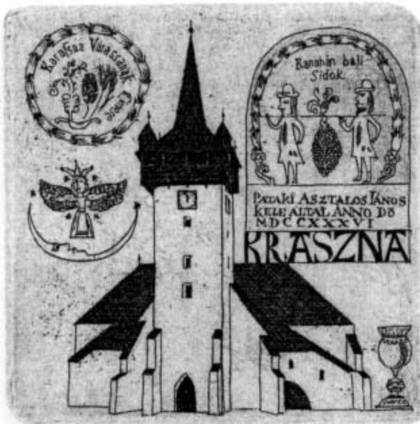
Az illusztrációkat Cseh Gusztáv „kolozvári képíró” könyvéből vettük: Libellus Pictus azaz képekkel írott könyvecskéje Jeles Házaknak (Kolozsvár, 2002)

Lássuk talán az első megfontolást. A régi, a történelmi Erdélynek igen sok olyan hagyománya létezik, amely a mostanában „multikulturálisnak” nevezett