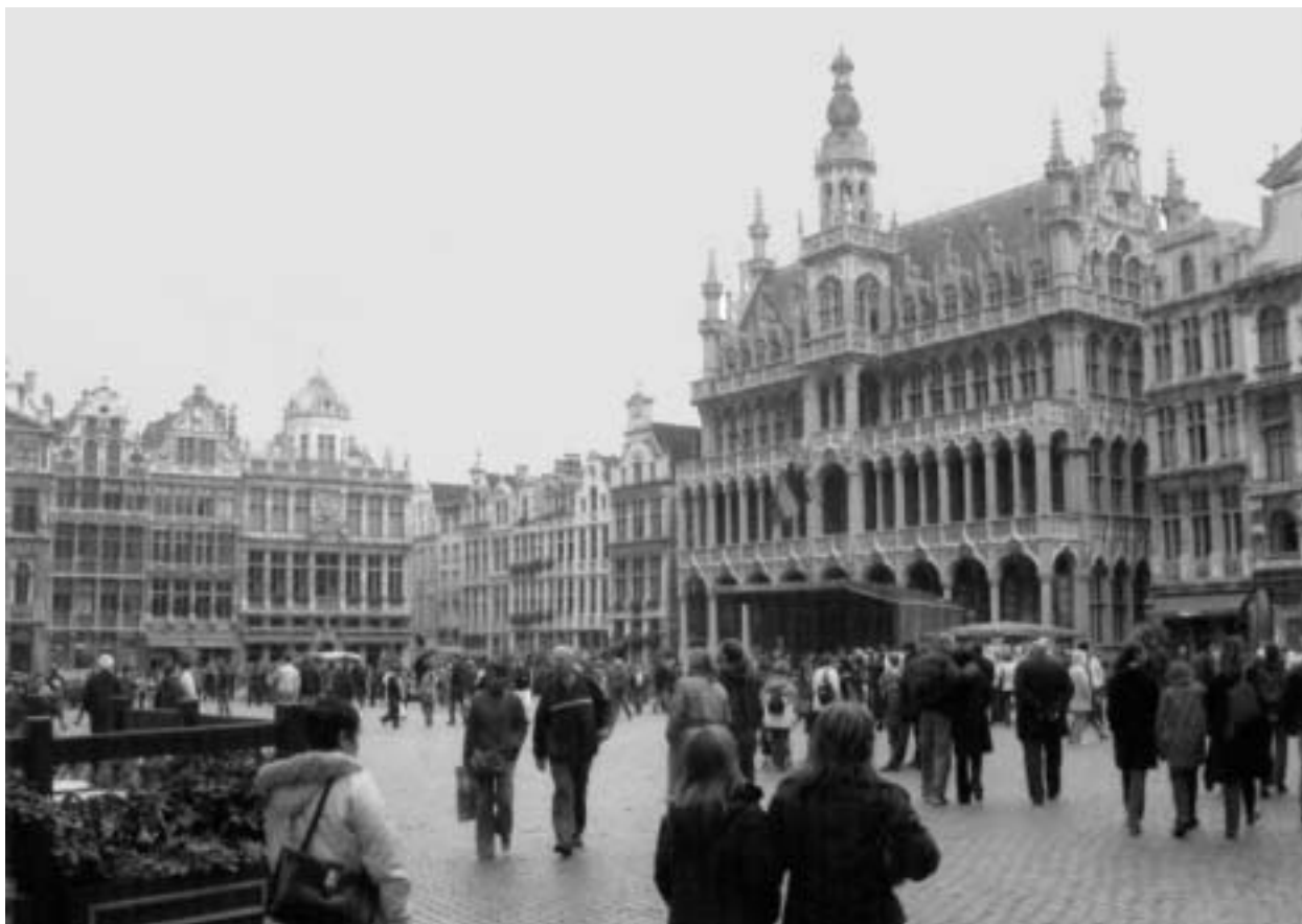
A Grand' Place

A brüsszeli életminőségének másutt is jelentős eleme a sok park és zöldövezet, amelyek a városi terület jóval nagyobb arányát borítják, mint Budapesten – és a közmondásosan esős éghajlat folytán nem szorulnak locsolásra. Brüsszelbe nem engedték be a multiplex mozikkal is hivatkozó plazákat, tulajdonképpen egyetlen igazi nagyáruház sincs az európai fővárosban. Van viszont minden délelőtt kirakodó vásár az óvárosi Jeu de balles (labdajáték) téren, ahol a jómódú közönség sem restell órákig böngészni a régi flamand csillárok, porcelánok, kristálypoharak között, és boldogan alkuozni egy-egy becses darabra. Európa fővárosában még találunk kis boltokat, van sarki fűszeres, sok hangulatos kisvendéglő és kocsmá, sehol sem kell