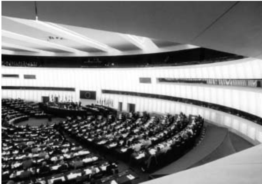
Az Európa Parlament tanácssterme

nyugati szövetségi rendszer, a transzatlanti kapcsolatok idegközpontja is.