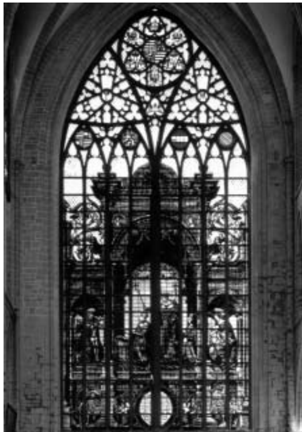
II. Lajos magyar király ábrázolása a Szent Mihály-székesegyház színes üvegablakán

A nemzetközi nyüzsgés, a sok intézmény és képviselő jelenléte ellenére a belga főváros meg tudta őrizni sajátos németalföldi karakterét, emberi léptékét és – főleg külső kerületeiben – bájosan kisvárosi hangulatát – miközben magán viseli a mai európai nagyvárosok jellegzetes vonásait is. Ez a sokféle hagyományból és színből kialakult szöttek gyakran meghökkenti a látogatót, de még azt is, aki mondjuk diplomataként vagy újságíróként évekre megtelepszik az európai központban. Egy amerikai újságíró például bizarrnak találta, hogy a város két legismertebb jelképe közül az egyik egy hetykén pisilő meztelen kislány, a másik meg az atomháború rémképét felidéző Atomium. A pisilő fiúcska, a Manneken Pis óvárosi szobrocskája körül mindig nyüzsgönek a turisták, főleg a nagy ünnepeken, amikor víz helyett sört pisil az odatartható poharakba. Az Atomium az 1958-as világkiállítás jelképe volt, ezt is rövid életűnek szánták, mint a párizsi Eiffel-tornyot, aztán tartósan a város jelképe és a turisták kedvenc kilátója lett. Nyilván akadnak olyanok, akik a kristályos vasmolekula 200 milliárdszoros felnagyítása láttán a láncreakcióra, az atombombára, az emberi önpusztításra asszociálnak róla.