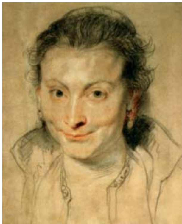
Rubens: Isabella Brant portréja

Schiele egyedi körvonalrajzú, szokatlan nézőpontból, közelnézetből vagy felülről ábrázolt városképei, tájképei között számos dekoratív, a háztetők cserepeit ( Ablakok , 1914) vagy a száradó ruhák színfoltjait felragyogtató festmény is van. Ezzel szemben Kis fa késő ősszel című kompozícióján (1911) a magányos fa antropomorf formája, az emberi szenvedés természetbe való kivetítése Csontváry Kosztká Tivadar Magányos cédrusához (1907) hasonlóan önarcképnek, reménytelenséget, kiúttalanságot sugalló hangulata miatt haláltáncnak tekinthető.