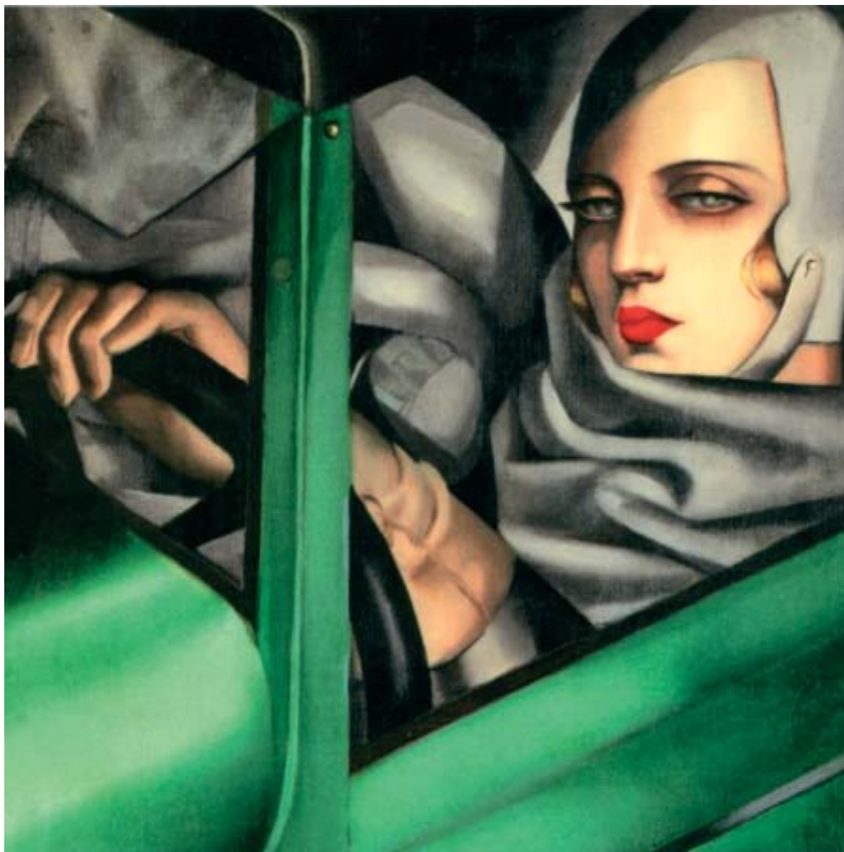
Tamara de Lempicka: Autós portré, 1929

réi, ahogy nálunk Batthyány Gyuláéi, a két világháború közötti felső tízezer életmódjába engednek betekintést. Figuráit könnyen elképzelhetjük a húszas évek funkcionális-dekoratív ízlését tükröző, üveg és fém uralta enteriőrjeiben. A legizgalmasabbak mégis a korai művek, melyeken a kubizmus, a futurizmus formavilága még erősebben érvényesült, s a reneszánsz és manierista formákkal való fúzió különös