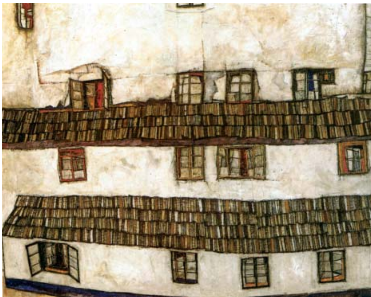
Egon Schiele: Ablakok, 1914

Bécs is hódol a szecesszió után egyre inkább tért hódító art déco divathullámnak. Tamara de Lempicka, orosz származású festőnő vonzó, nagyvilági hangulatú művei láthatók a Kunstforum termeiben. A hideg, fémes színvilágú festmények fehér testű, csábos pillantású nőalakjai az olasz manierista festők és Jean Doiminique Ingres hideg érzékiségű aktjainak utódai. Hasonlítanak a fehér kála virághoz, amelyet szintén szívesen festett az art déco korszak végzetes asszonytípusát megteremtő festőnő. Port-